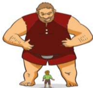
El gigante egoísta

Continuamos con lectura de cuentos, EL GIGANTE EGOISTA