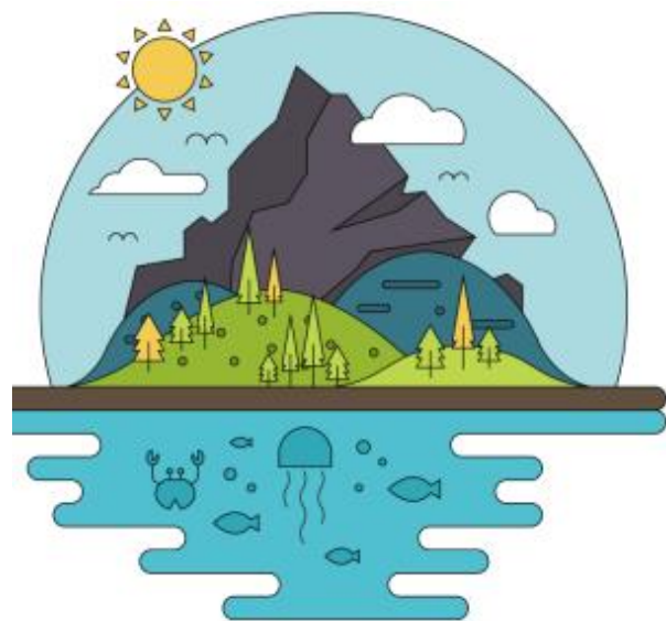
Figura 3. Las montañas, los ríos, los bosques, las costas y los mares son ejemplos de recursos naturales con los que cuenta un país.

El incremento en el uso de combustibles fósiles tiene un impacto negativo en el planeta, porque genera un exceso de gases de efecto invernadero que causan el calentamiento global.