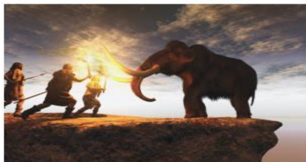
Figura 2. Cazadores intentando atrapar a un mamut.

Pero ¿sabes cuál es la diferencia? La población son las personas que viven en un determinado lugar, tal como pueblos, caseríos, barrios o ciudades. Se considera sobreproducción cuando aumenta el número de habitantes en una determinada región o comunidad, siendo tan grande que los recursos que se encuentran disponibles ya no son suficientes para mantenerlos, alterando su ecosistema circundante,