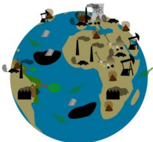
Figura 1. Los ecosistemas se alteran de forma negativa por los efectos de la sobreproducción en el planeta.

A pesar de todos estos beneficios que recibimos de los ecosistemas (ej. bosques, mares y ríos, lagos), el acelerado incremento de la población humana y el uso excesivo de los recursos naturales promueve el deterioro ambiental y genera un desequilibrio en los ecosistemas (Fig. 1)