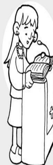
Lecturas y salmo