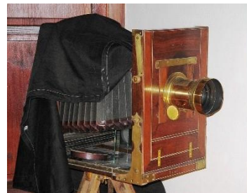
Cámara de fuelle (1840-1850)