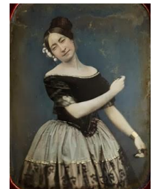
Retrato daguerrotipo de una bailarina de la escuela bolera, con castañuelas (hacia el año 1850)

Actividad 2. Lee la siguiente información.